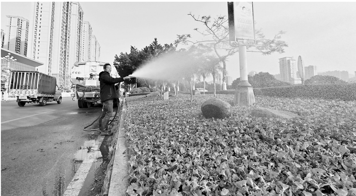
江北大道世界城段,绿化带中已经摆上节日鲜花,工人们正在进行浇水养护。