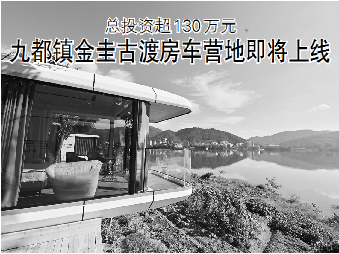
太空舱面湖而立，尽享阳光和美景。

本报讯（记者 黄俊涛 李想 文/图）九都镇金圭古渡房车营地（太空舱）已经完工，预计本周末投入使用。这是记者近日从南安市九都镇政府获悉的。