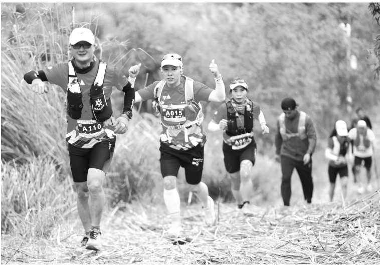
参赛选手沉浸式感受“云端小镇”的山野魅力。

本次比赛是南安首次举办越野跑赛事，获得了国际越野跑协会（ITRA）和环勃朗峰越野跑（UTMB）的双重认证。所有完赛的选手均可获得相应积分，并可以参与全球积分排名。积分高的选手可以获得诸多赛事的精英免费名额，且可以获得参加UTMB系列赛的报名资格。 赛事设40公里精英组、25公里大众组、8公里体验组3个组别，既为高水平选手提供竞速的舞台，也让广大越野跑爱好者能够参与其中。 跑福地、有福气。比赛路线串联起南安第一峰——云顶山的“云海风车”，南安第一漂——龙腾峡