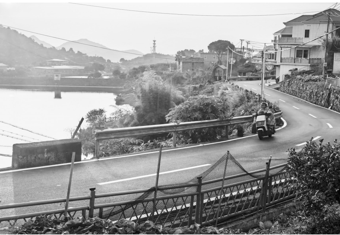
从山城村路口开始,新路面向村庄深处蜿蜒延伸。

本报讯(记者 庄树鸿 黄奕群 通讯员 李智锰 文/图) 近日,记者从南安市蓬华镇了解到,山城村多方筹资140多万元,完成了全长2公里的村级主干道Y159线“白改黑”工程。