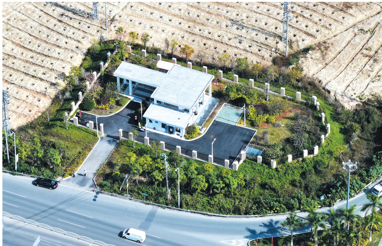
已竣工验收的污水提升泵站