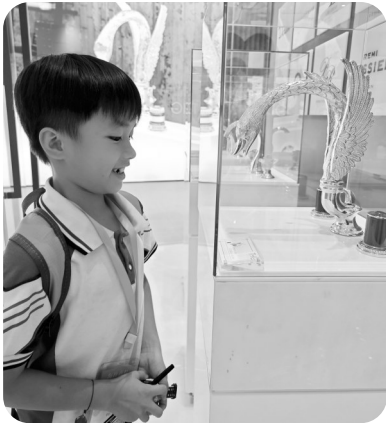
哇，黄金打造的水龙头！