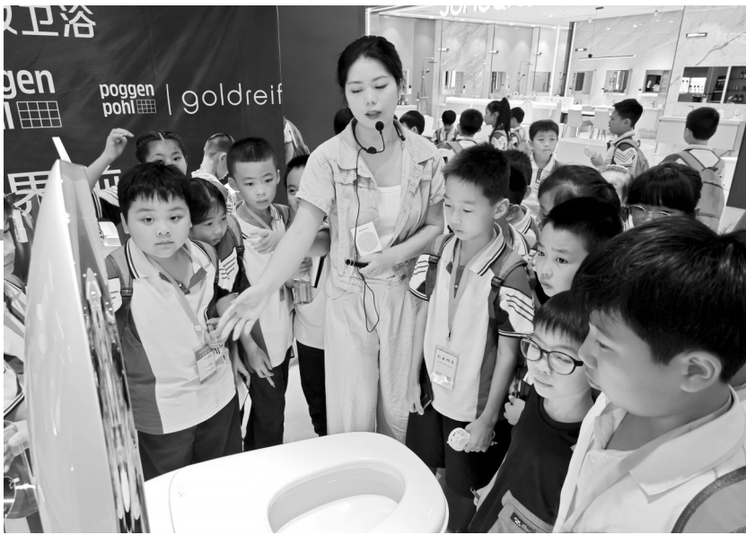
工作人员介绍智能马桶。

在展厅中，各式各样的卫浴产品琳琅满目，令人目不暇接。其中，智能马桶以其激光感应自动冲厕的功能，展现了极高的便捷性，赢得了我们的连连赞叹。而能够灵活调节水流强度与范围的水龙头，则满足了不同场景下的用水需求；更令人印象深刻的是那些配备按摩功能的浴缸，让人在享受沐浴的同