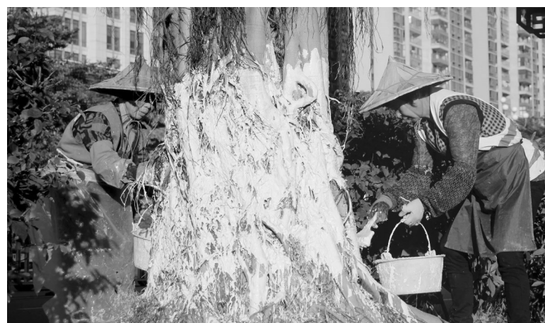
园林工人正在为绿化树涂白。

的黑暗、肮脏的环境相悖,能预防一些爬行类害虫从土壤中爬到树干上,吃掉树上的芽与叶子,影响树的生长。