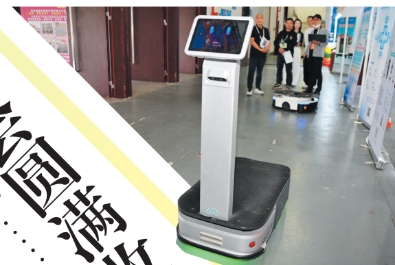
展会上,“黑科技”集中亮相。