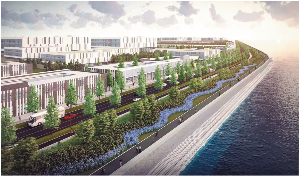
南安市海峡科技生态城B片区综合产业园效果图

土石方工程作为整个项目的基础,总面积达178.85万平方米。目前,该工程正在紧锣密鼓地进行中,为产业园的后续建设提供了有力保障。此外,电子产业园作为项目的重头戏,总建筑面积40万平方米,其中,工业生产