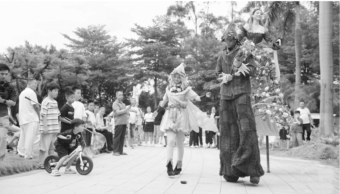
乌镇戏剧节特邀剧团“小逗号剧团”带来了经典剧目——《仲夏夜之梦》。

南安文旅将游客“请进来”，也频频“走出去”。国庆期间，利用泉州古城游客大批涌入、创下历史新高的契机，10月4日至5日，在泉州中山路，南安高甲戏快闪表演惊艳登场，为游客呈现精彩的文化盛宴，也递上南安文旅名片。