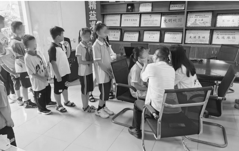
工作人员进行学生氟斑牙筛查。

市疾控中心联合霞美卫生院，在霞美蓝贝贝幼儿园举办了一场以“口腔健康 全身健康”为主题的全民健康生活方式宣传活动。