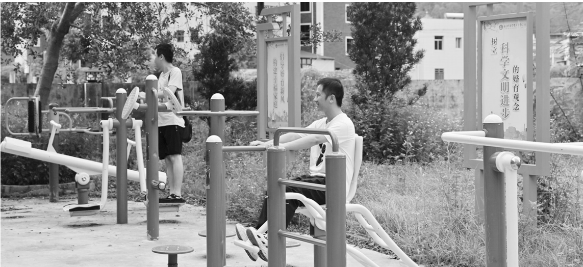
乐峰福山村婚育主题公园一角