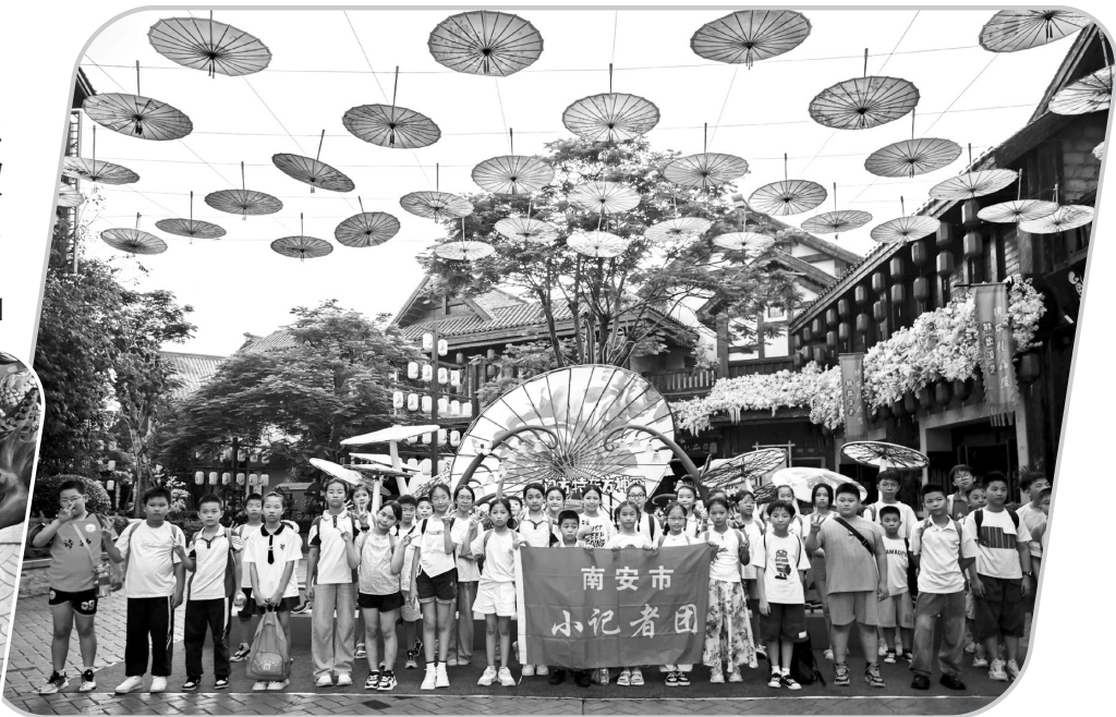
▲小记者合影 ▲探秘海底龙宫 ▼体验游乐设施