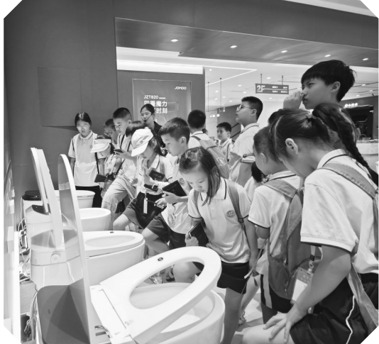
工作人员介绍展品

这次九牧之行，让我深刻感受到了科技时代的魅力和力量。我相信，随着科技的不断进步，我们的生活将会更加美好！