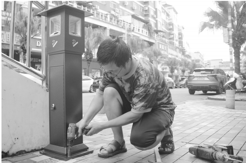
工人正在安装烟蒂柱。

本报讯（记者 陈江涛 通讯员 李瑞勇 文/图）垃圾可以分类投放进垃圾桶,但作为火源的烟蒂,该如何投放?近日,记者从南安市城市管理和综合执法局了解到,该局联合南安市烟草专卖局,将在市区成功街、新华街、民主街、中山街、南大路、普莲路、河滨路、江北大道等10多条主要道路,设置105个烟蒂柱,主要放置在公交站、人流密集的路口处,方便烟民处理烟灰、投放烟蒂。 在新华街路侧,记者就找到数个烟蒂柱,烟蒂柱主体高1.1米左右,仿古造型,外表为古铜色防锈漆,投放口约两指宽,上方有一块铝合金洞洞板,方便“熄烟”。虽然烟蒂柱才刚安装上,但已经有使用过的痕迹了。 “有了烟蒂柱,确实会方便很多。”在市区人民会堂公交站等车的老林告诉记者,他有着30多年的烟龄,等车时烟瘾犯了,想吸上一口,又想到没有地方扔烟蒂,就得忍一下,“毕竟乱扔烟蒂会显得自己很没素质”。