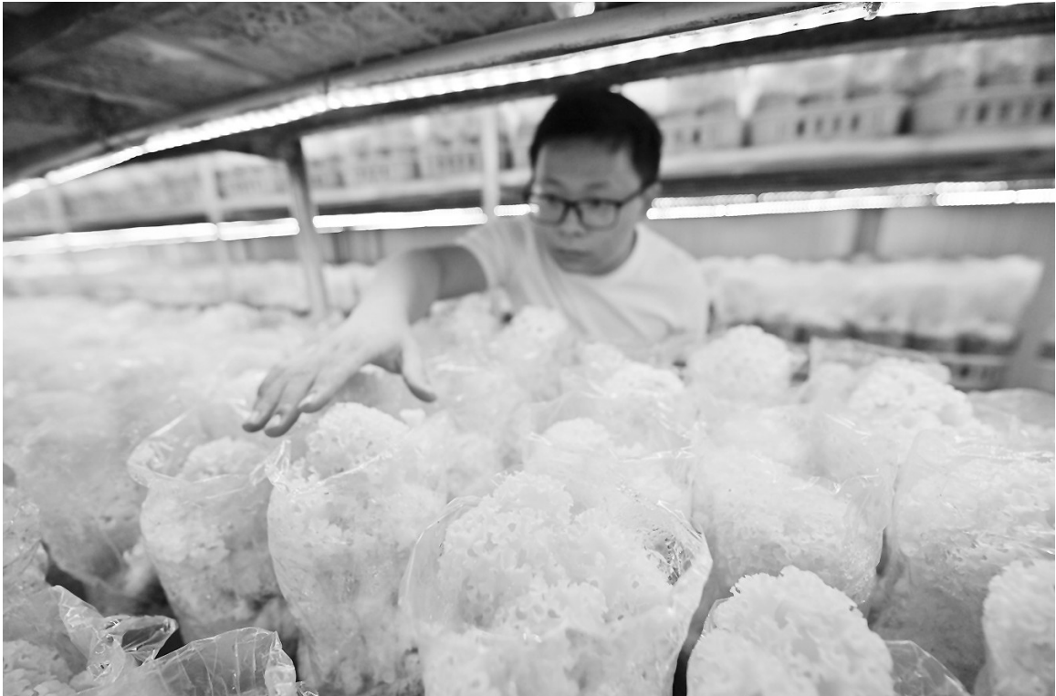
迎来丰收的绣球菌长势良好。

现场,五傅宗亲会共发放奖励金2万余元,奖励23名在今年高考中录取本科院校的福铁傅氏优秀学子。康美镇福铁村五傅宗亲会成立于2016年,于每年8月举行奖学金发放仪式,至今已连续9年发放奖学金,累计金额超10万元。