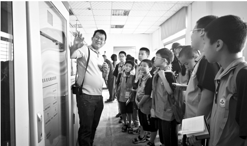
讲解员介绍监测设备

经过指导员的细心讲解,我才知道这家监测站主要是同水污染作斗争,那一排精密的仪器便是监测水中有害物质是否超标的好帮手。同时,我还知道了重金属超标的危害,没想到,在我们生活当中,竟有如此之多隐