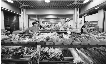
市场商户已基本回迁。

本报讯（记者 朱晓西 李想 通讯员 郭海生 文/图）近日，南安水头综合市场完成提升改造。目前，市场经营商户已基本回迁。