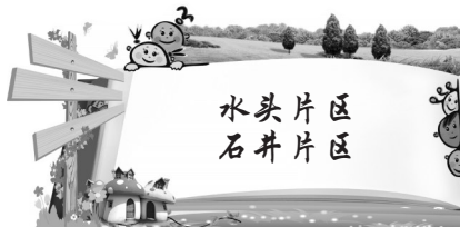
水头片区 石井片区

近日,龙门小学、第三实验小学、水头中心小学滨海校区、奎霞小学近百名小记者走进水头中骏世界城,开展暑假夏令营职业体验活动,小记者通过了解职业、体验职业,收获成长的印记,让我们一起看看小记者发过来的最新报道。