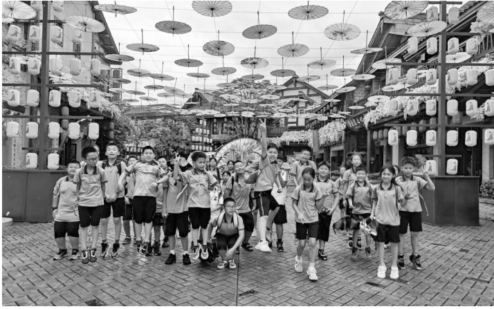
畅玩厦门方特神画世界

在博物馆中,那里还有一处网红景点,那是一条长长的走廊,是用一些不同种类的岩石修建而成的,非常漂亮,吸引了众多摄影爱好者前来拍摄打卡。博物馆里的每一个物件,都承载着它独有的故事和历史,蕴含着丰富的历史文化内涵,这也正是我满怀热忱向您推荐的原因。