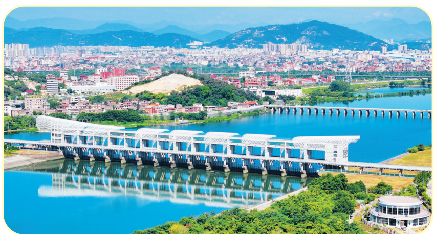
金鸡拦河闸和金鸡桥