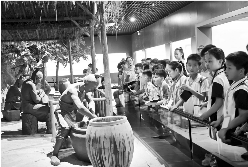
了解陶瓷制作流程

一方水土养一方人,一道河流润一方文化,梅溪的水在微风中泛起层层波纹,在波纹流动的瞬間,瓷器的釉色闪烁。瓷器文化源远流长,从1500多年前至今,伴着流动的溪水,缓缓地,缓缓地在泉州这片土地上绽开一抹色彩。 今天,小记者团来到了泉州古代外销