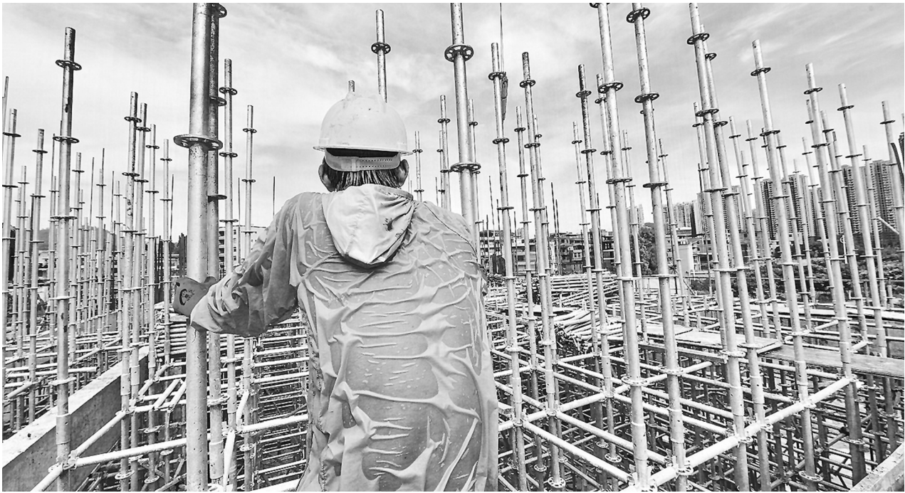
高温下,工人的衣服被汗水浸透。

黄少明建议,市民晒伤后应及时在皮肤晒伤部位使用湿毛巾或冰袋冰敷,每次持续15分钟—20分钟,可以有效减少渗出及肿胀,还有助于缓解疼痛。但应注意温度不宜过低,避免冻伤。皮肤受到紫外线的照射之后,可能因缺水而导致皮肤干燥,因此市民要做好肌肤的补水工作,可以适当