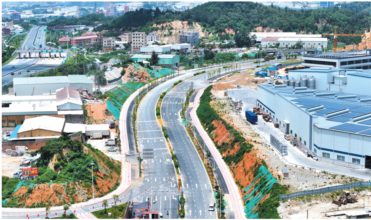
杨子大道(二期)的通车,将进一步激发区域经济的活力与潜力。

本报讯(记者 庄树鸿 李想 通讯员 伍三萍 文/图)经过一年多的紧张建设,备受关注的杨子大道(二期)已正式竣工并通车。