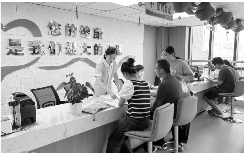
舒适、明亮、宽敞的体检环境受到市民的欢迎。

“我们将通过早筛查、早预防、早诊断、早治疗,实现从疾病管理向健康管理模式的有效转变,努力提高健康管理服务的专业化、规范化、个性