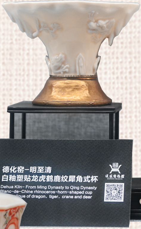
◀明至清德化窑制品,白釉塑贴龙虎鹤鹿纹犀角式杯。