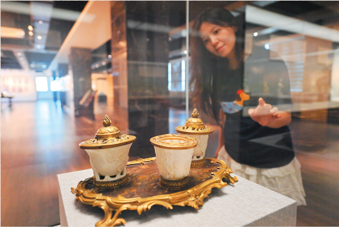
明末清初,德化窑制品,欧洲改装回流的墨水台。