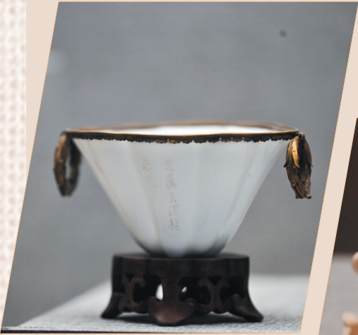
清德化窑制品,白釉印花花卉纹杯。