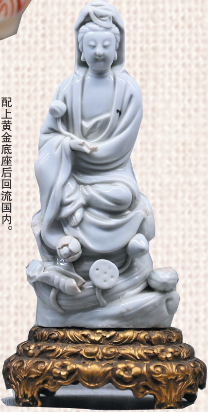
配上黄金底座后回流国内。 ▶清代德化窑观音塑像。