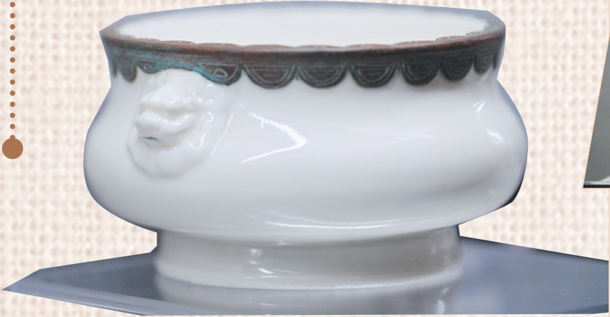
▲明代德化窑香炉,丁水奇珍款。