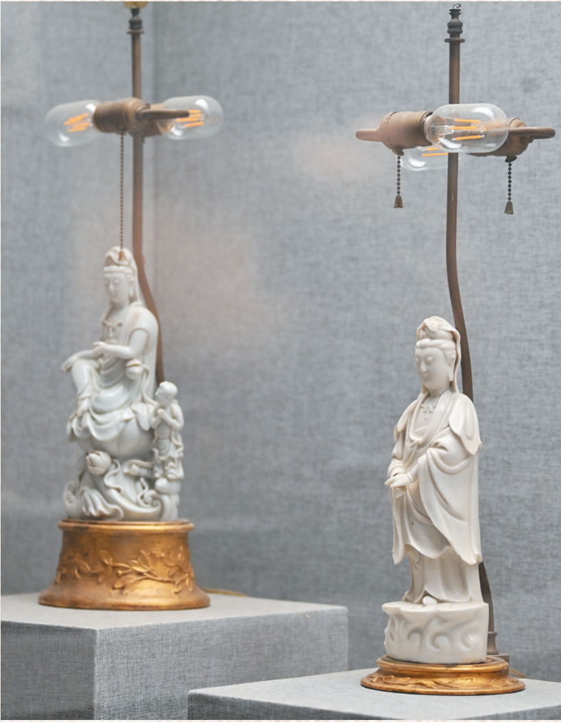
▶清代德化窑制品,被欧洲匠人改造成台灯。