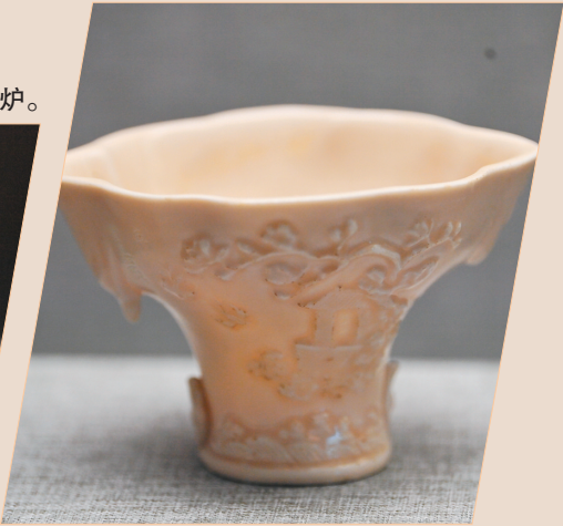
明代德化窑,龙虎杯。