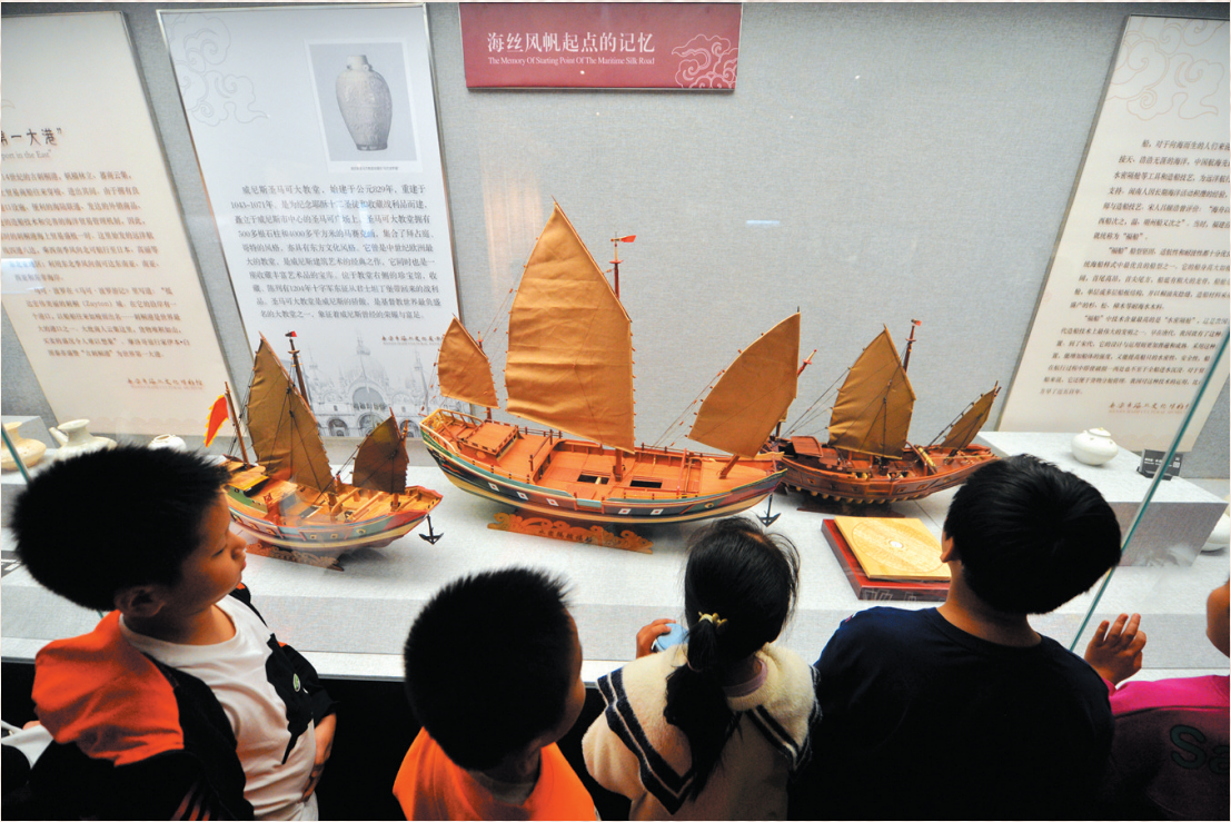
在汉侯博物馆研学孩子。