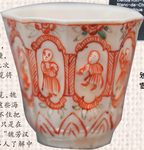
◀明至清德化窑,白釉划花花卉纹八方斗式杯,图案为西方市场所定制。