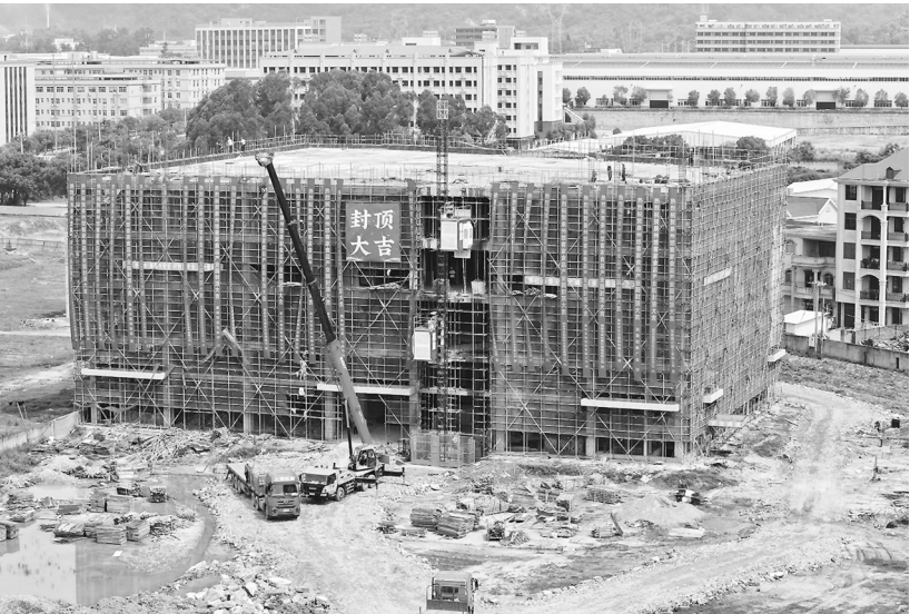
悠客家休闲食品产业园项目建设现场

据悉，悠客家休闲食品产业园项目计划建设7栋厂房和1栋6层综合楼，总建筑面积约5万平方米，建成后，将打造集研发、生产、销售、仓储物流、电商为一体的休闲食品产业园。