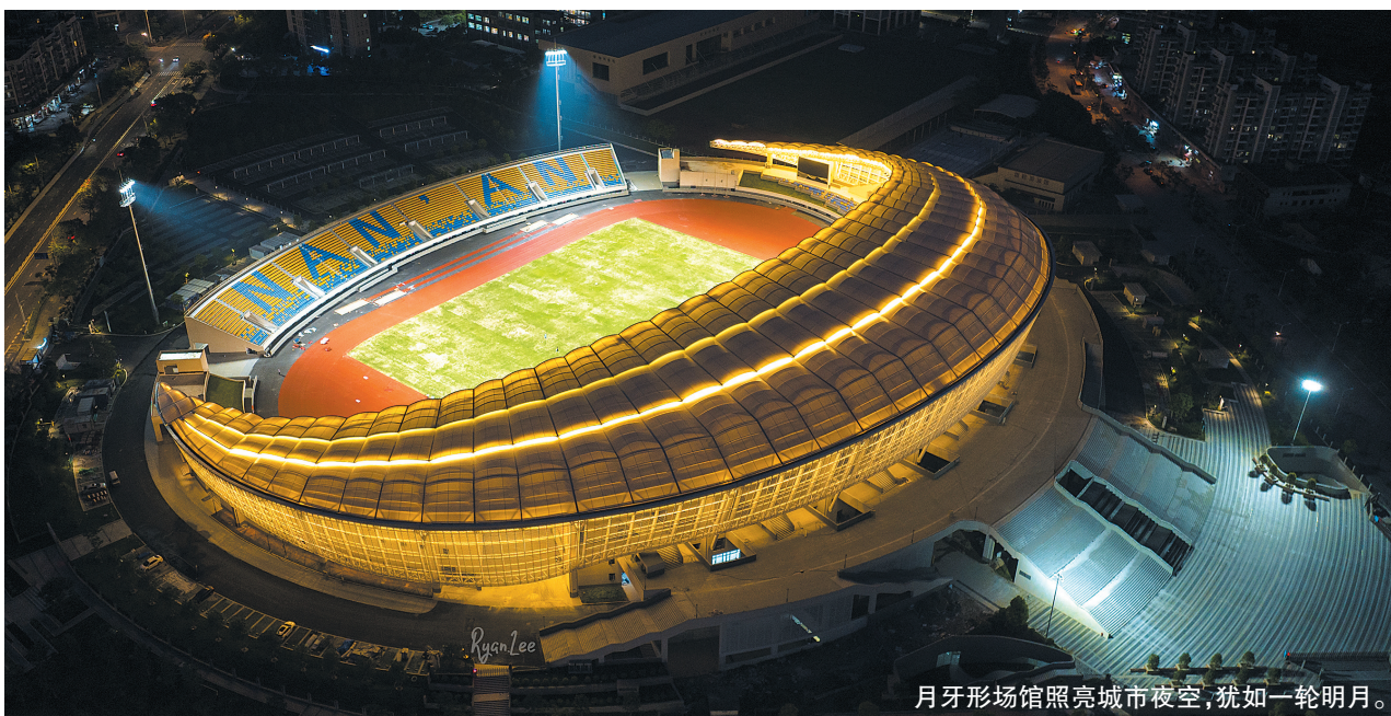
月牙形场馆照亮城市夜空,犹如一轮明月。

本报讯（记者 李贵灵 李宇翔 通讯员 黄成贵 文/图）连日来,不少市民发现,一到晚上,南安市体育场灯火通明,月牙形场馆照亮城市夜空,犹如一轮明月。那么,目前体育场建设如何?什么时候交付使用?8日,记者走进体育场,一探究竟。