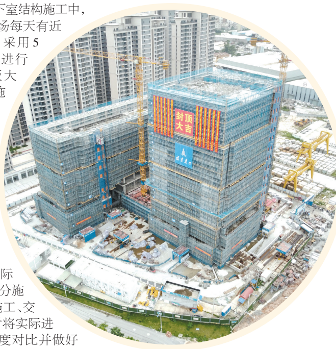
南安市石材建陶双创孵化基地项目

如在攻坚地下室结构施工中,高峰时期现场每天有近300人施工,采用5台泵车同时进行地下室底板大体积混凝土施工浇筑,调用了130辆搅拌车运输保障。此外,项目管理团队严格按照PDCA循环的全面质量管理模式,根据施工实际情况,明确划分施工段、流水施工、交叉作业,及时将实际进度与计划进度对比并做好纠偏,合理分配项目施工攻坚任务,确保项目建设高效有序推进。