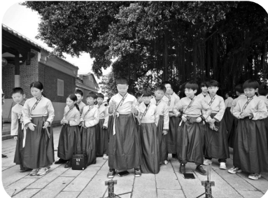
体验古代君子的必修课“六艺”。

的生活,老师还组织了一次体验活动——当盐工。我穿上厚重的雨靴,手持又长又大的耙子,小心翼翼地走进盐田。边走边推盐的过程中,我感受到了太阳的炙热和空气的咸湿。几趟下来,汗水已经湿透了衣背,我渴望能找到一片树荫,躲避这炎炎烈日。