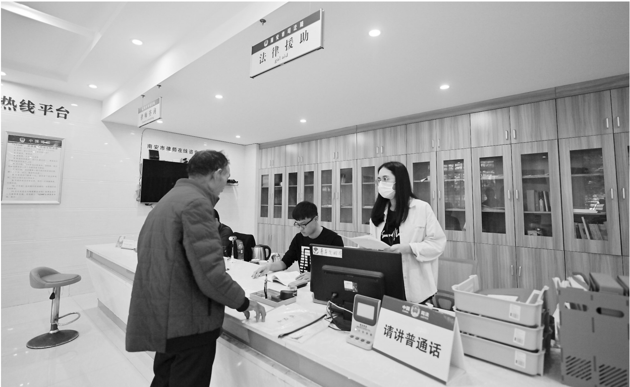
工作人员为群众提供法律援助。(资料图)

这只是南安公共法律服务助企纾困解难的一个缩影。近年来,市司法局立足“服务发展+营商环境”双轮驱动,推出公证利企十条措施和组建市公共法律服务团,打通公共法律服务企业的“最后一公里”。据了解,2023年以来,全市办理公证4221件,为民