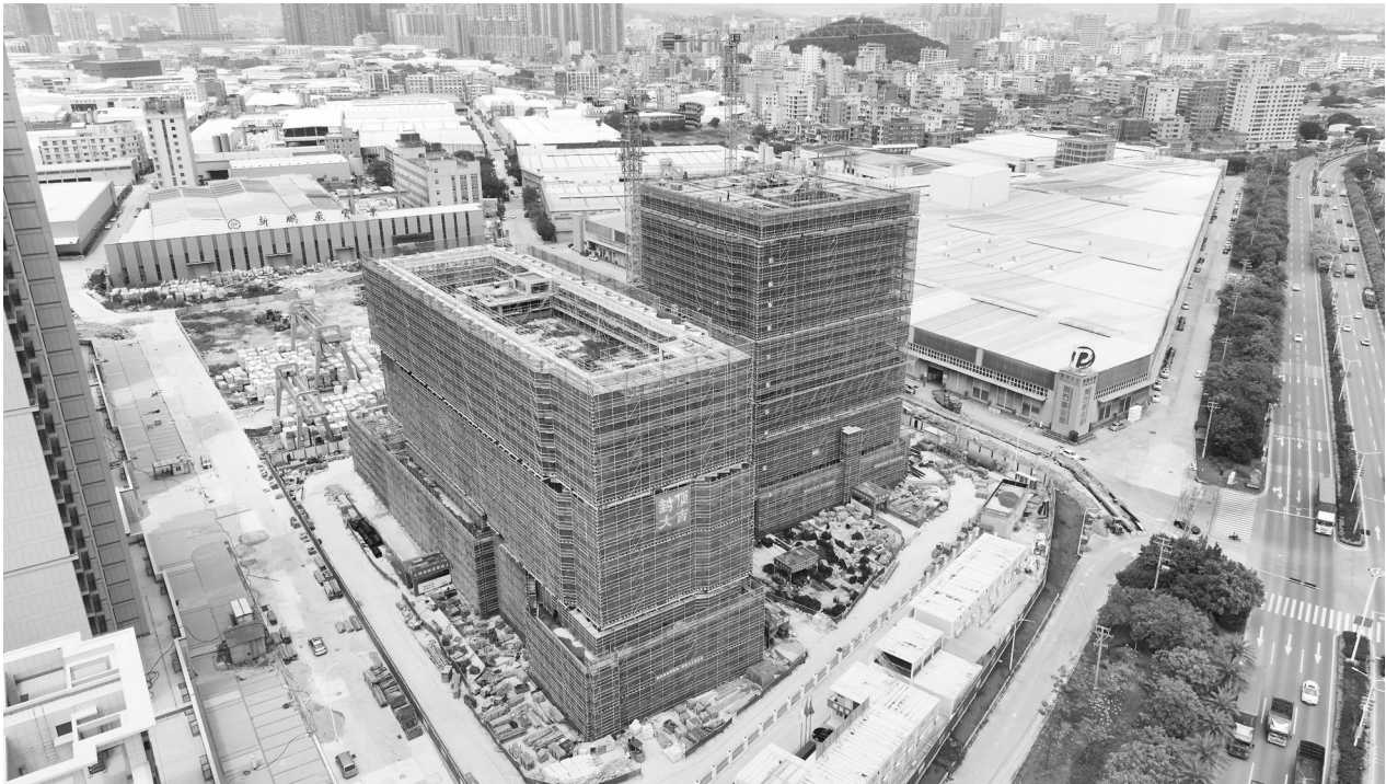
南安市石材建陶双创孵化基地项目施工现场。

“该项目的落地，必将推动石材产业高质量发展，为石材产业发展插上创新的翅膀。”水头镇相关负责人介绍，水头镇是国内最大的石材物流中心和石材进出口基地，也是世界石材最大的贸易基地之一，质检中心建成投用后，不仅将促进质监部门提升服