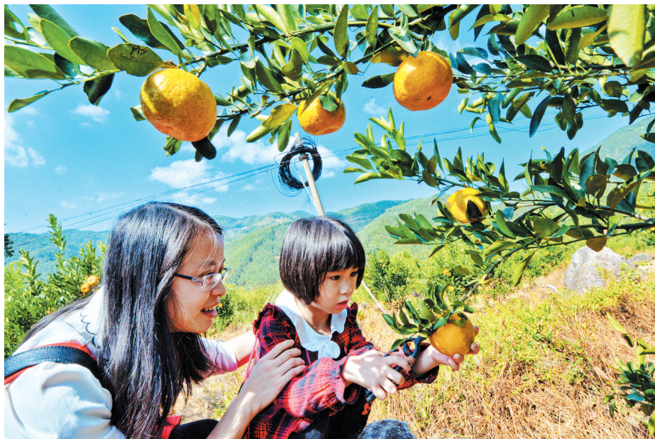
九都新民村丰收的芦柑吸引了游客前来采摘。

新民村获评高级版“绿盈乡村”。 金圭村获评福建省高级版“绿盈乡村”荣誉。 彭林村、新峰村、秋阳村、新民村获评中级版“绿盈乡村”荣誉。 新东村、新民村获评省级文明村。 金圭村获评“福建省金牌旅游村”;壮志滑翔伞基地被国家体育总局航空中心授予“中国航空飞行营地”称号。 彭林村、金圭村获评省级卫生村称号。 美星村获评省级森林村庄。 新民村、彭林村获评第二批省级乡村治理示范村。 新东-新峰-新民-金圭获评福建省乡村振兴示范线;金圭村、新民村获评省级乡村振兴示范村。