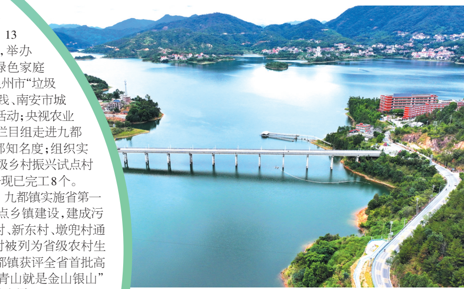
县道325线与墩兜大桥。

2019年,壮志滑翔伞基地被国家体育总局航空中心授予“中国航空飞行营地”称号,并以滑翔伞运动为核心,发展成广大滑翔爱好者的培训、体验、比赛、休闲度假基地,借助旅游的传播和赛事的影响,带动产业聚集,打造特色乡村,取得了较好的经济效益和社会效益,成为金圭村全力打造“逐梦山水·文旅金圭”的一只“金凤凰”,2020年,九都镇金圭村被评为“福建省金牌旅游村”。