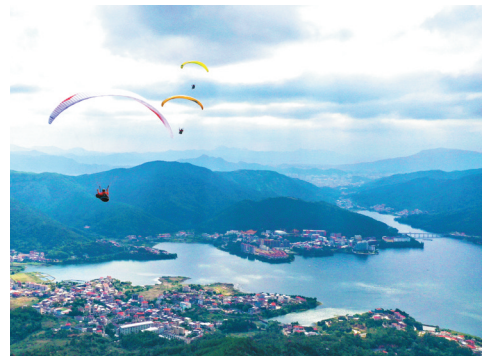
位于九都的滑翔伞基地。