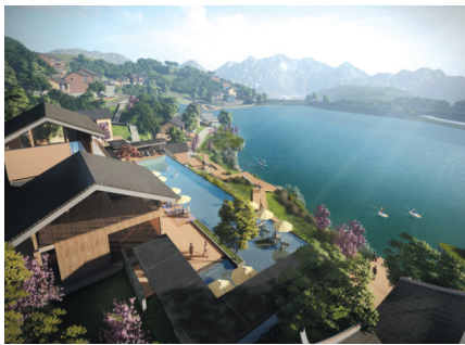
南安市乡村振兴示范线九都示范线。