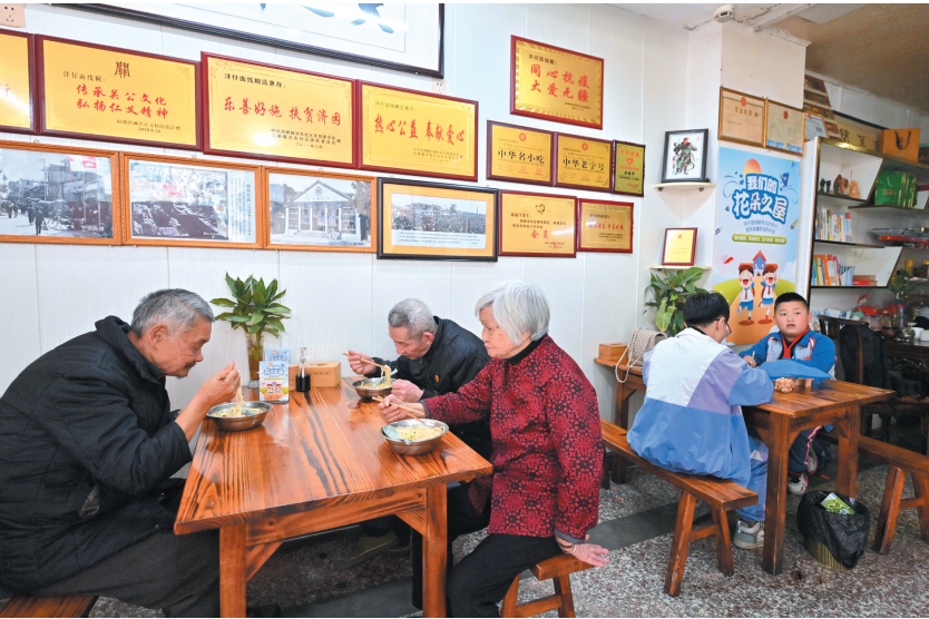
面线糊店里,孩子们边做作业边等家长,一旁的几位老人正在享用免费午餐。

环顾四周,记者发现,这家店面不大,但整洁清爽,店门口、墙壁和每张桌子上都有“花朵之屋”标识牌。店内一角还摆放了笔、橡皮擦、词典、作文集等文具图书,学生需要时,可免费借用。