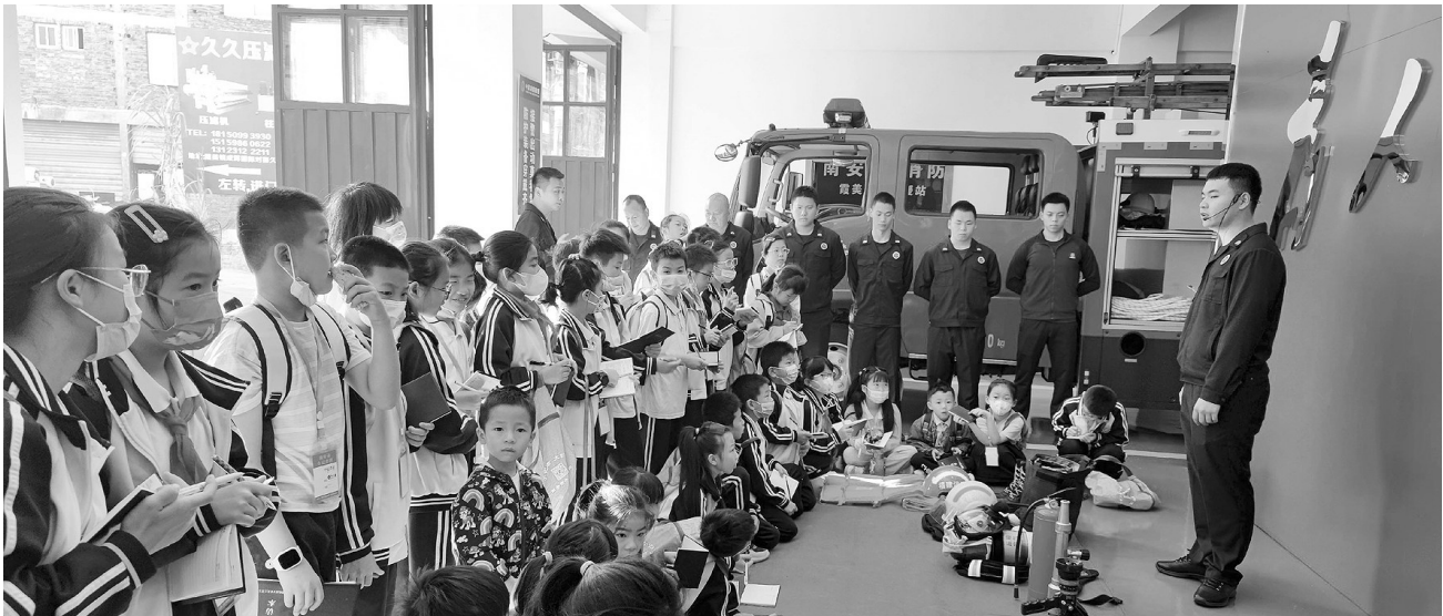
消防员介绍消防设备。