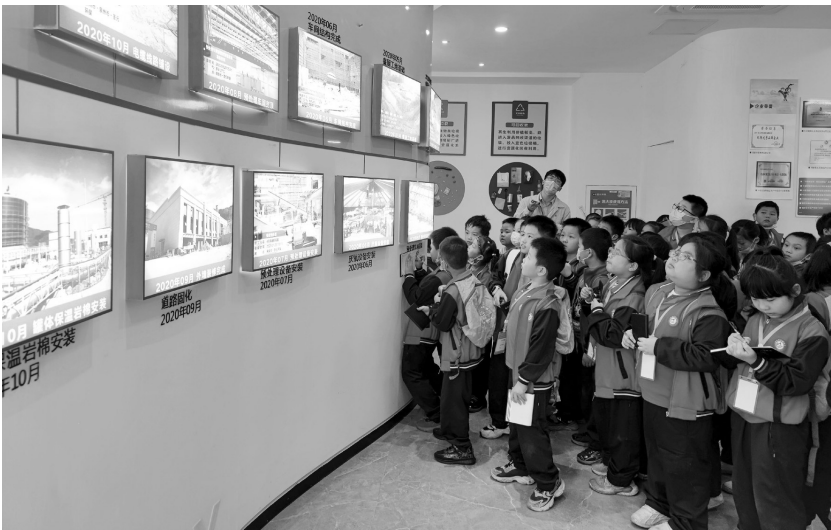
工作人员介绍企业文化。