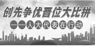
■本报记者 洪丽燕 李想 文/图

“要当好一名称职的人大代表，最基本的‘标准’就是要坚持以人为本，主动作为。”日前，在接受记者采访时，南安市人大代表朱斌如是说。 扎根南安创业的20多年里，朱斌将公司从名不见经传的小加工作坊发展为国内机械密封行业的领军企业；他一路深耕标准化领域，为南安、泉州乃至全国标准化工作的推进做出了不俗的贡献；疫情防控的三年里，他坚持“以人为本”，在保障生产的同时做好企业疫情防控工作，更带着病痛奋战在南安抗疫一线，被人们亲切地称为“大家长”。