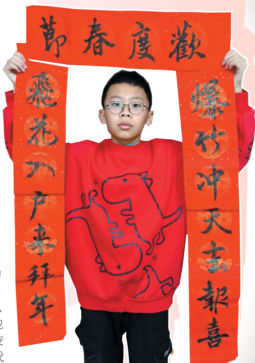
小记者展示自写春联。

在喷香扑鼻的年夜饭中,饺子可是主角,包饺子通常也是一家老小都要参与的活动。在我们家,有着多年烹饪经验的奶奶负责最有技术含量的部分