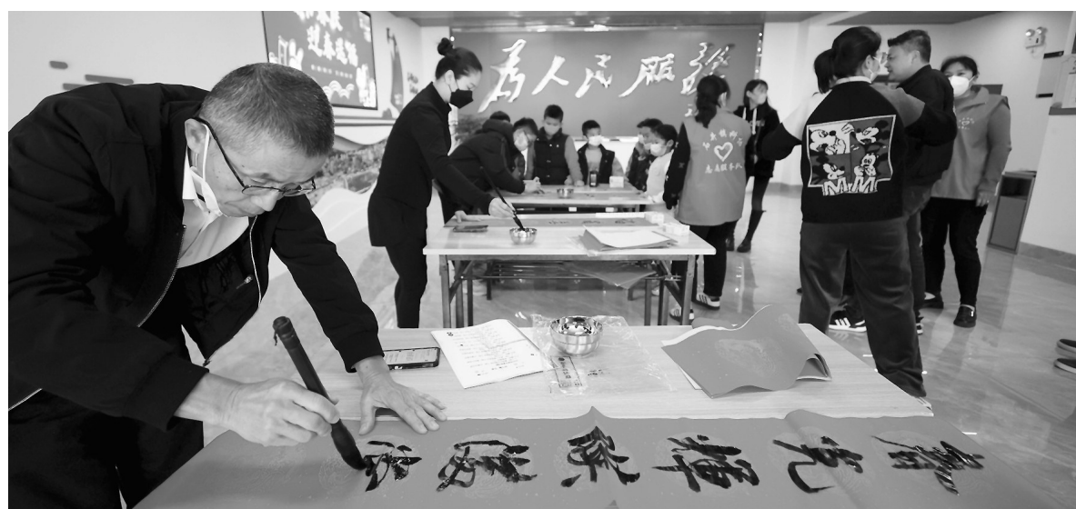
新春祝福。书法爱好者们通过写春联活动,为村民提前送上

本报讯(记者 黄艺彬 黄奕群 文/图) 18日,口岸联检服务单位联合石井镇营前村,开展“共书春联、迎春送福”活动,为当地村民、困难群众及台胞台属义写春联。