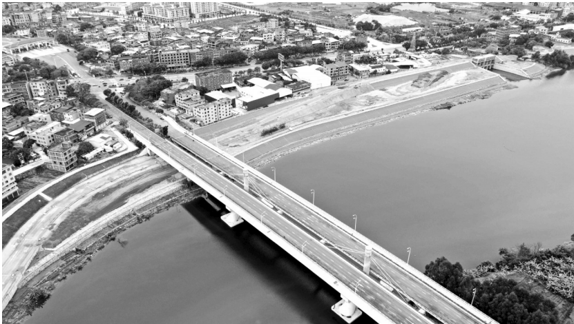
晋江防洪工程(二期)南安城区三期右岸堤段。

“防洪治理工程建成后,不仅能提高河道防洪标准,还能有力保障附近居民生命财产安全,从根本上消除洪灾隐患,对促进当地经济发展,维护社