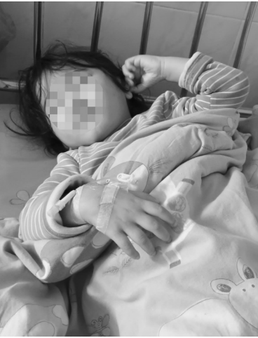
躺在病床上的小圆。