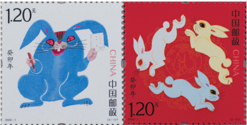
《癸卯年》特种邮票。

新华社北京1月5日电 中国邮政5日发行《癸卯年》特种邮票。邮票一套两枚,分别名为“癸卯寄福”“同圆共生”。