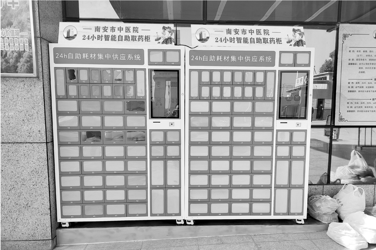
南安市中医院新引入的智能自助药柜。

扶正解毒1号(成人治疗方)、扶正解毒2号(儿童治疗方),有健脾化湿、扶正解毒、调理肠胃、增强免疫力等功效,对感染病毒患者的治疗有辅助作用。此外,南安市中医院组织中医专家,结合南安地域和气候、市民