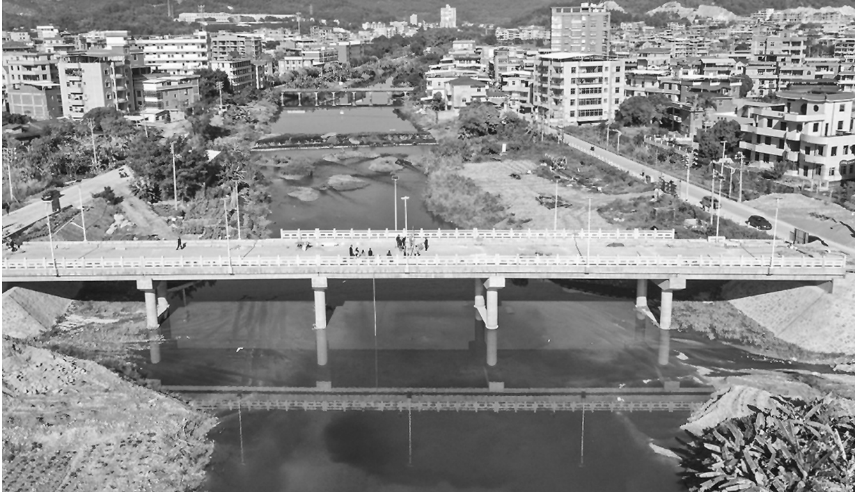
码头大桥建成后，将方便附近村庄 1 万多人的出行。

“这些天，我们主要进行人行道施工、伸缩缝预建设，预计 1 月 15 日前完工。我们也将加班加点施工，确保春节前完成主体建设。”谢洋溢说。