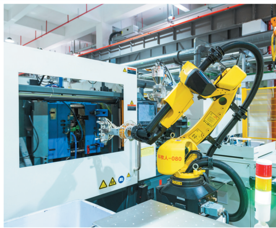
九牧智能马桶灯塔工厂,机器人取代人工,大大提高生产效率。