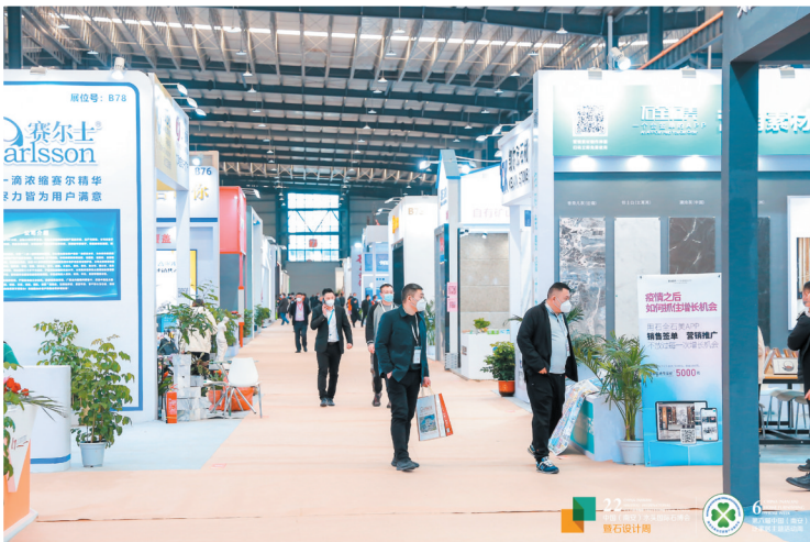
时隔两年,石博会再度重启。

除了三安光电这一半导体龙头外,金阳新能源20GW异质结电池项目开工后,意味着金石能源和金阳新能源这两大新能源领域的龙头企业也进入了泉州“芯谷”。不久的将来,南安在新能源赛道有望实现弯道超车。