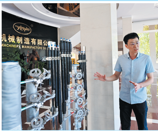
作为国家级重点“小巨人”,英侨机械在疏水阀领域深耕30多年。