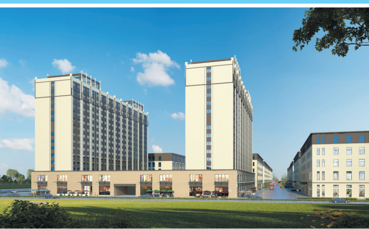
奥飞智能卫浴产业园标准厂房效果图。