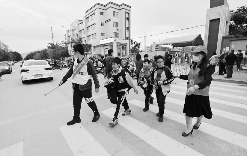
护岗队在南安市第十五小学门口护送学生过马路。

记者发现,除了帮忙疏导校门口的车流、人流的警察和家长,人群中还有“红马甲”的身影。“我是温山村村民,也是霞美镇志愿者协会的成员,对学校附近的情况很了解。”自“警校家”