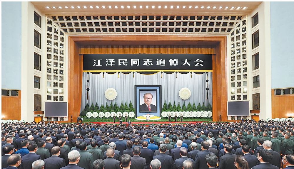
12 月 6 日，中共中央、全国人大常委会、国务院、全国政协、中央军委在北京人民大会堂隆重举行江泽民同志追悼大会。