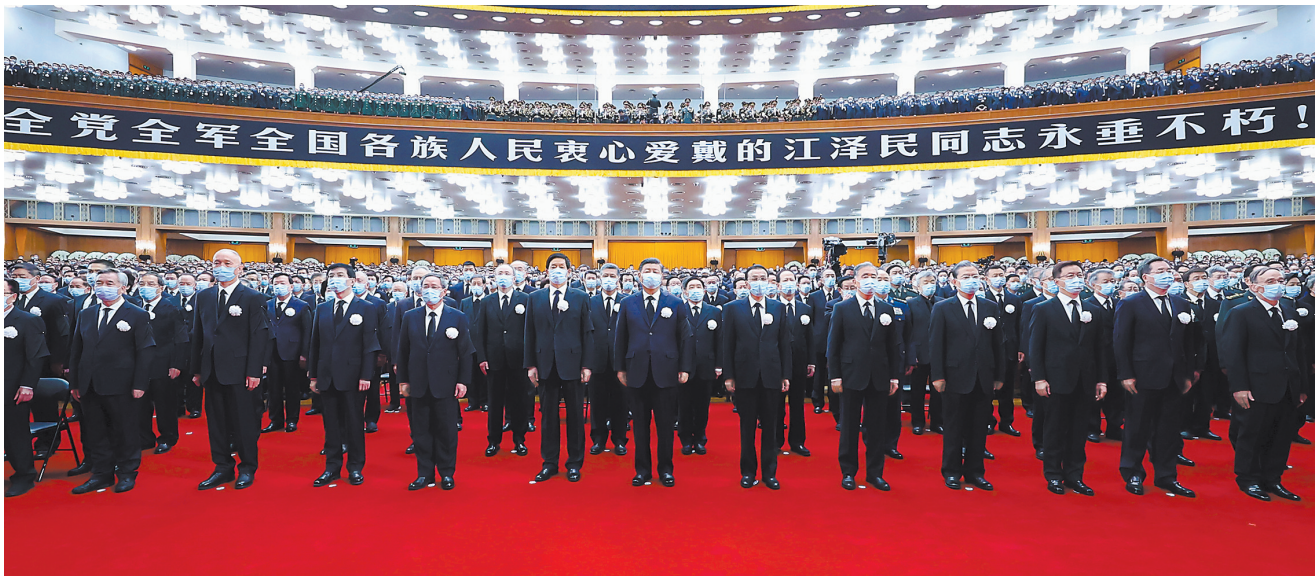
12 月 6 日，中共中央、全国人大常委会、国务院、全国政协、中央军委在北京人民大会堂隆重举行江泽民同志追悼大会。习近平、李克强、栗战书、汪洋、李强、赵乐际、王沪宁、韩正、蔡奇、丁薛祥、李希、王岐山等参加大会。