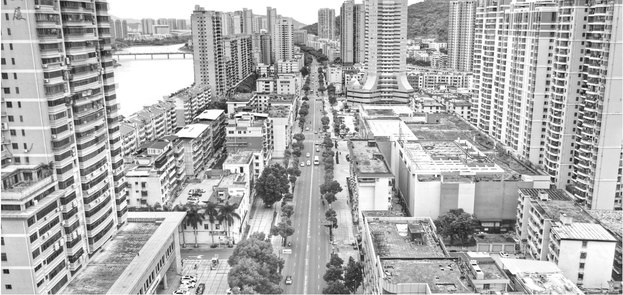
成功街两侧进行整治改造提升。

了南安城市“颜值”。走进市区，记者看到，长安街原本红黄相间的彩砖，已经被换成崭新的红色防滑透水砖，新铺的人行道平整协调，盲道、无障碍坡道更加规范；环城西路段的人行道增设了截水沟，旧窨井盖、雨水篦子被更换为铸铁材质，路边的树池也已贴上石板材”。从长安街踏入新华街，新增了“黄丝带”盲道；南大路人行道及盲道已完成提升改造；南安大道增加了道路辅道、慢行系统和绿化带……一点一滴的改变，都在彰显着这座城市的温度。