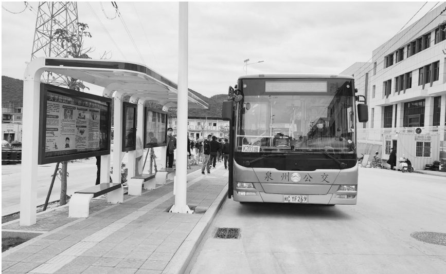
K203 路线的开通，打通了南安和泉州市区居民公交出行“最后一公里”。

本报讯（记者 李杨瑜 通讯员 林佳琦 文/图）泉州（南安）高端装备智造园经泉州市区至泉州清源山 K203 路公交专线开通啦！1 日上午 8 时许，标有“K203 清源山风景区—南安高端装备园”的车辆从清源山风景区站发车，迎来了该线路的首次运行。