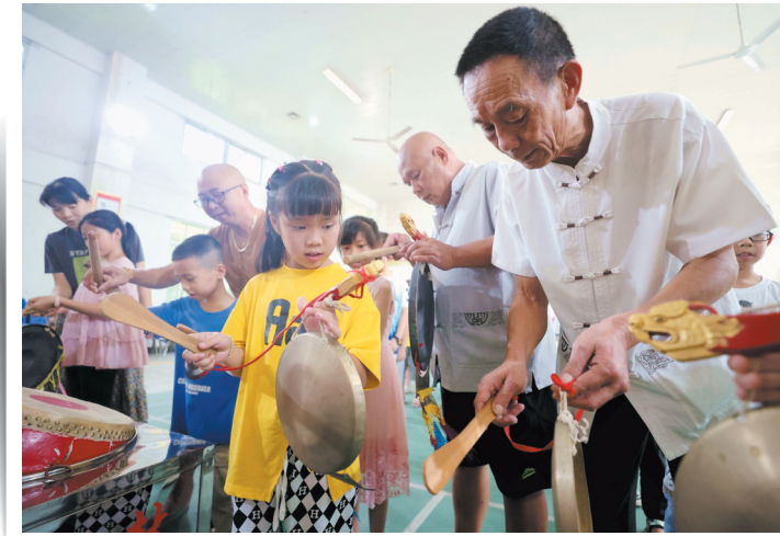
凤坡村开展暑期民俗文化活动。