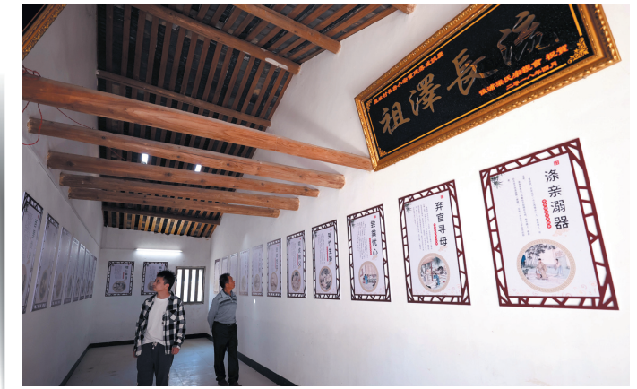
凤坡村家风家训馆。