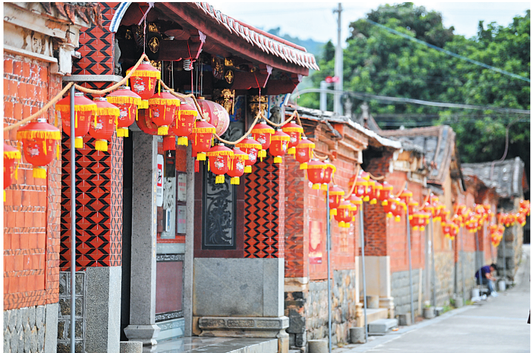
英都国家级非遗拔拔灯跟坂埔古厝在一起。