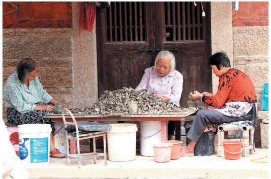
奎霞村也是海蛎养殖的村落。