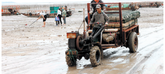
奎霞村靠海吃海,村民世代以海为田耕作不息。