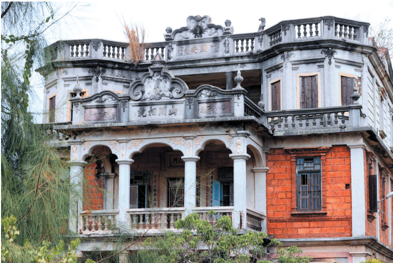
泉胜楼具有中西合璧的建筑风格。