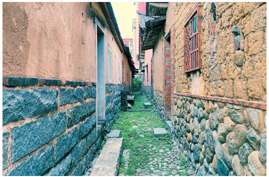
坂埔古厝老宅间的深巷,多少前人往事在此经过。