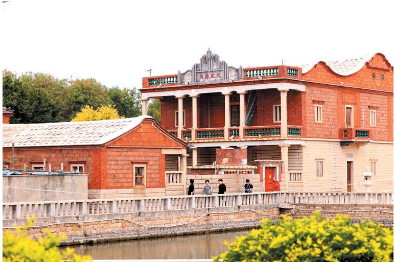
奎霞建筑群吸引各地游客前来参观。