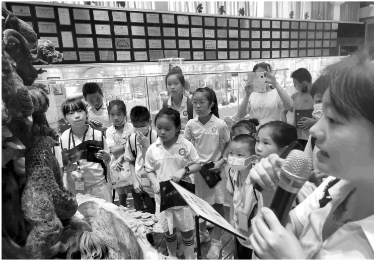
认真聆听讲解员讲解。