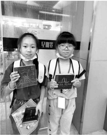
展示自己的雕刻作品。