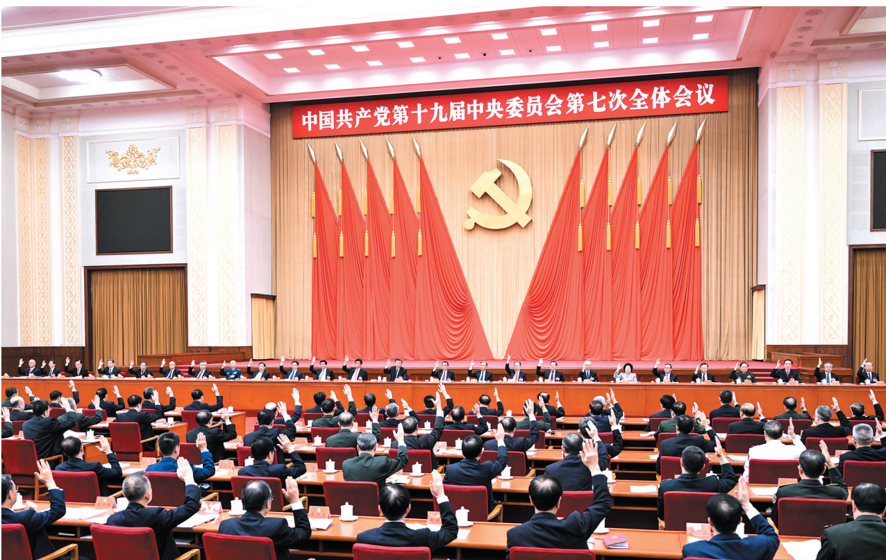
中国共产党第十九届中央委员会第七次全体会议,于 2022 年 10 月 9 日至 12 日在北京举行。中央政治局主持会议。

新华社北京 10 月 12 日电 中国共产党第十九届中央委员会第七次全体会议公报(2022 年 10 月 12 日中国共产党第十九届中央委员会第七次全体会议通过) 中国共产党第十九届中央委员会第七次全体会议,于 2022 年 10 月 9 日至 12 日在北京举行。 出席全会的有中央委员 199 人,候补中央委员 159 人。中央纪律检查委员会委员和有关负责同志列席会议。