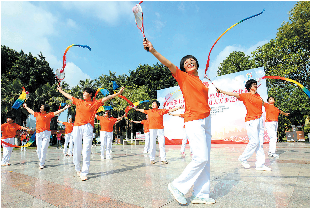
市民尽情享受运动带来的快乐。

10 年来，南安持续推进社会保障精准化、精细化，救助标准持续提高，城市居民最低生活保障标准从每人每月 380 元提高到 900 元，农村居民最低生活保障标准从每人每月 230 元提高到 900 元，城乡分散供养特困人员、城乡集中供养特困人员最低生活保障标准分别提